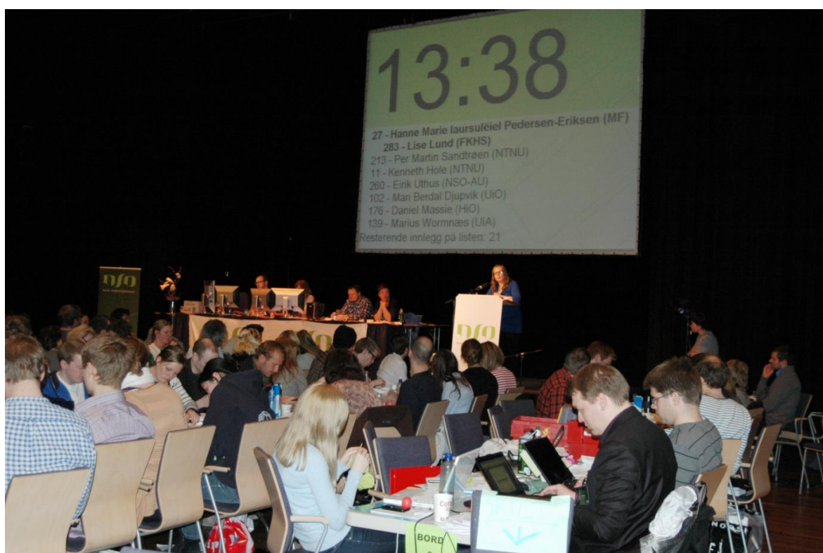
Talerlisten vises på skjerm slik at alle vet når det er deres tur til å snakke.

Når du vet du er neste på talerlisten, eller har fått replikk, så går du snarest frem og stiller deg på anvist plass ved talerstolen. På denne måten bruker vi ikke unødig tid på å vente på noen som er på vei opp til talerstolen. Ta med mentometerknappen og talekortet ditt. Dersom noen tar replikk på ditt innlegg og du ønsker svar, trykker du på mentometerknappen eller viser talekortet til ordstyrerne mens replikkene pågår.